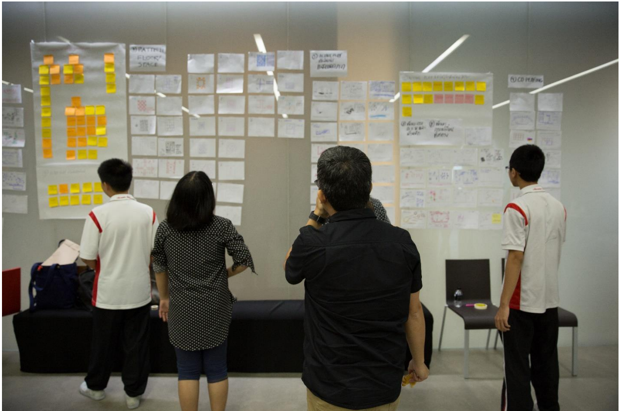
รูปภาพที่ 5 กิจกรรม Active Play Ideation