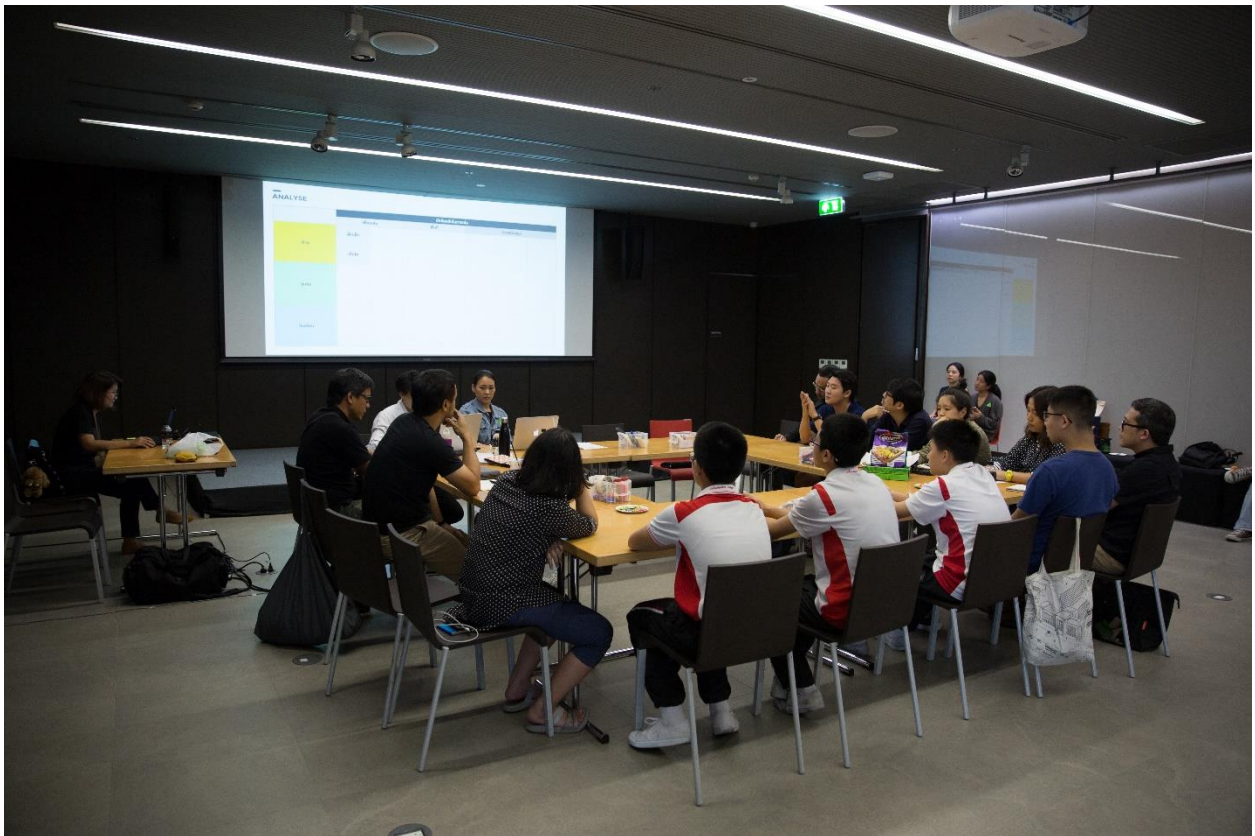
รูปภาพที่ 1 กิจกรรม Active Play Ideation ตัวแทนคณาจารย์ นักเรียน จากโรงเรียนอัสสัมชัญ และทีมนักวิจัย