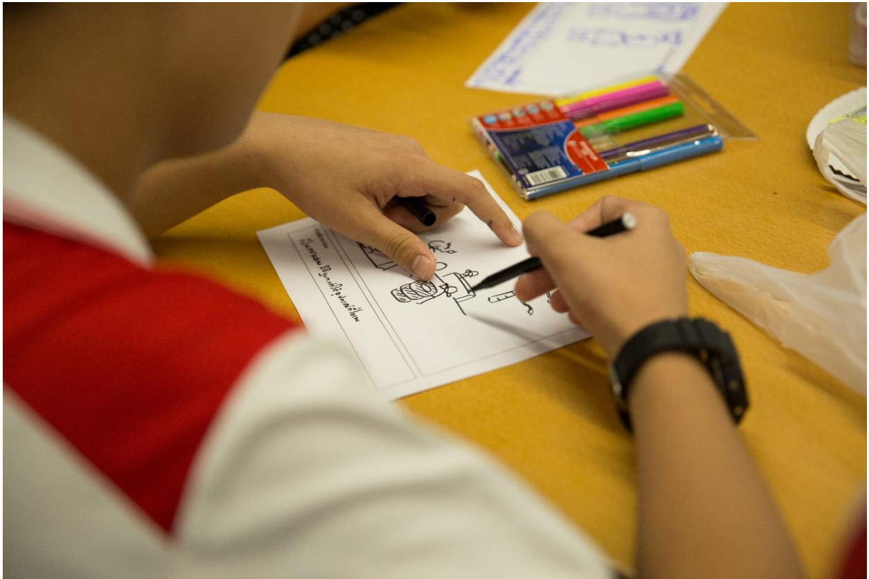
รูปภาพที่ 2 กิจกรรม Active Play Ideation