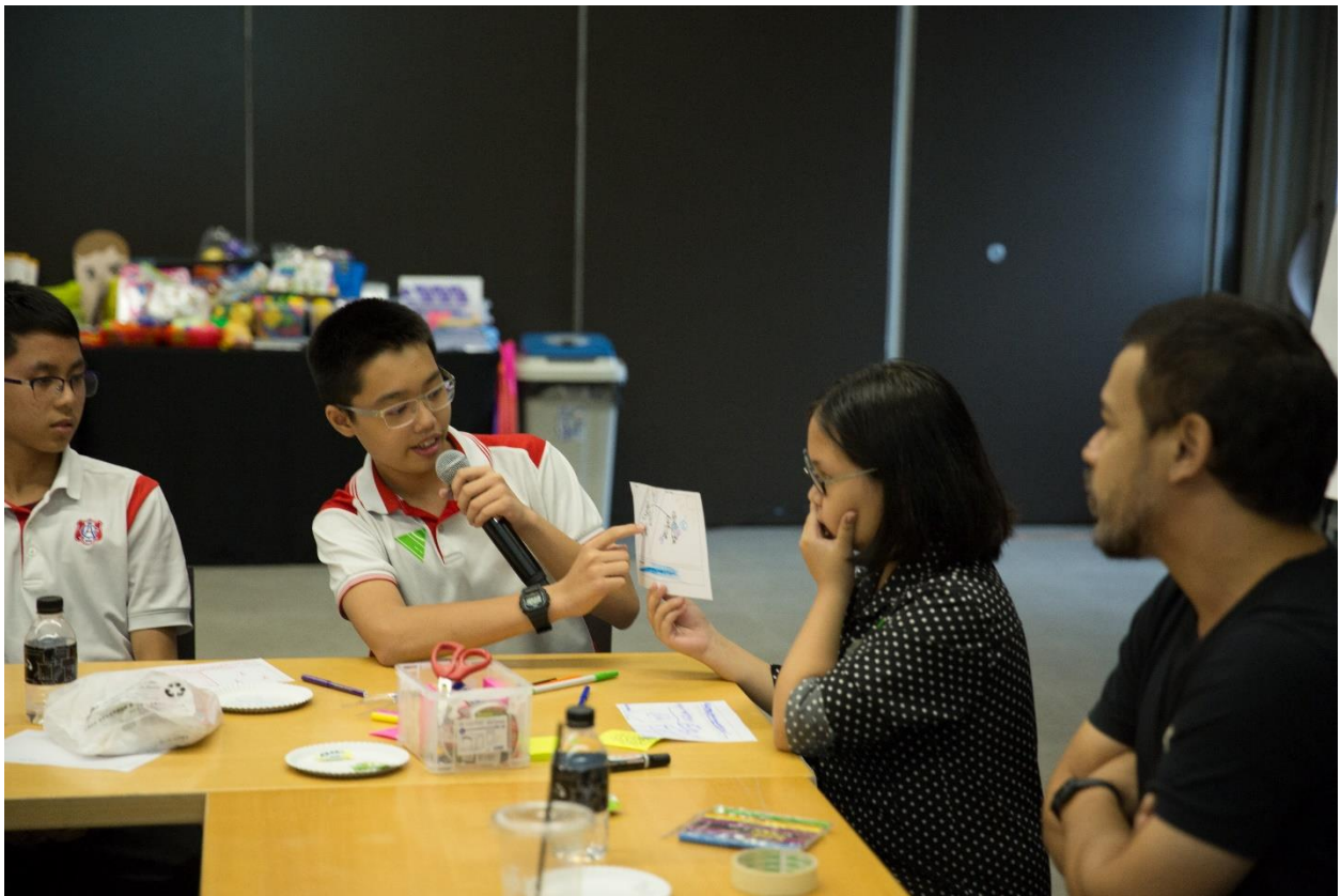
รูปภาพที่ 3 กิจกรรม Active Play Ideation