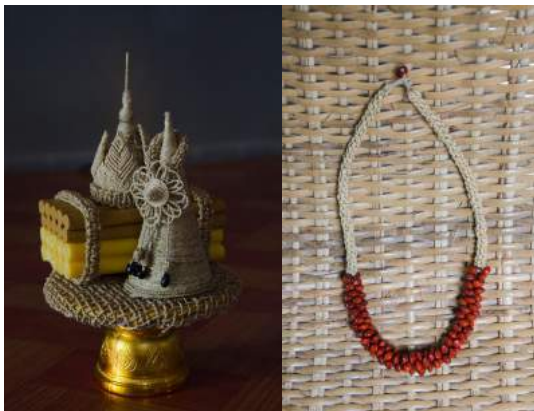
กลุ่มดอกไม้ประดิษฐ์จากวัสดุธรรมชาติ ผลิตภัณฑ์หัตถกรรมจากใบหญ้าแฝก และเมล็ดพันธุ์พืช