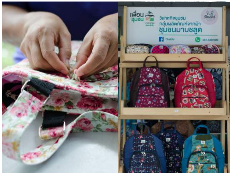
วิสาหกิจชุมชนผลิตภัณฑ์จากผ้าชุมชนมาบชลุด กระเป๋าผ้า Chulud