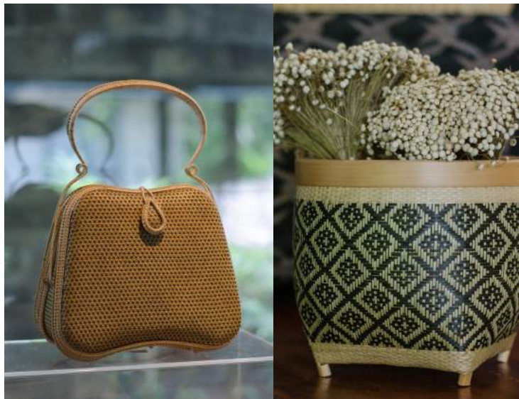
ศูนย์ส่งเสริมฝีมือจักสานด้วยไม้ไผ่ ผลิตภัณฑ์จักสานด้วยไม้ไผ่