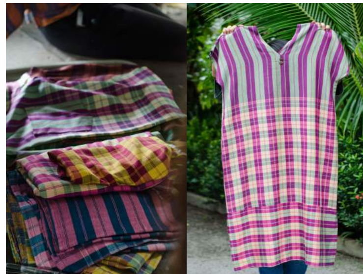
วิสาหกิจชุมชนคลองน้ำหูผ้าหมักน้ำนมข้าว ผ้าฝ้ายหมักน้ำนมข้าว