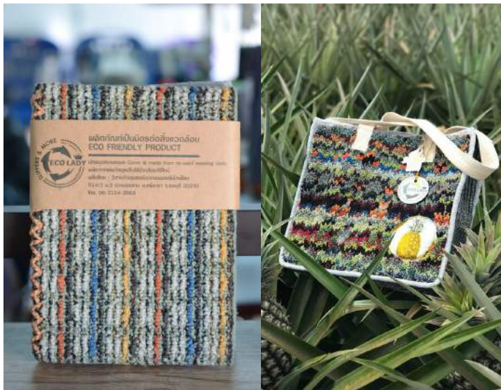
วิสาหกิจชุมชนหัตถกรรมสตรีรักษ์โลก ผลิตภัณฑ์จากเศษวัสดุอุตสาหกรรม