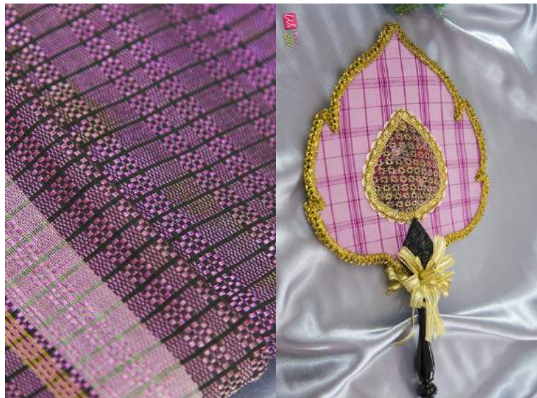
ผ้าทอมือคุณย่าท่าน บ้านปึก-อ่างศิลา ผลิตภัณฑ์ผ้าทอมืออ่างหิน