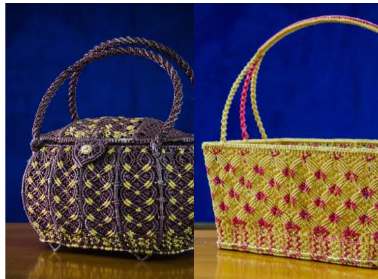
กลุ่มส่งเสริมอาชีพตำบลท่าข้าม กระเป๋าก็กจากเชือกมัดฟาง