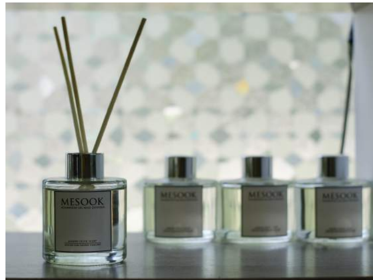
กลุ่มเกษตรผลิตไม้กฤษณา(สวนหอมมีสุข) ผลิตภัณฑ์จากไม้กฤษณา