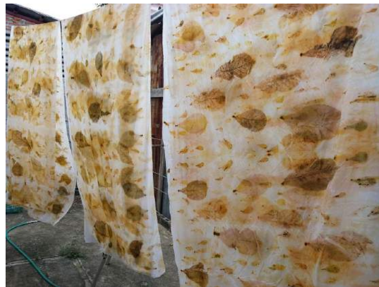
ลีลาฝ้าย ผ้าหมักโคลนทะเล ผ้าฝ้ายทอมือ Ecoprint