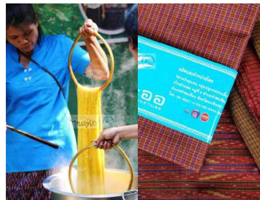
วิสาหกิจชุมชนกลุ่มปลูกหม่อนเลี้ยงไหม ทอผ้าบ้านอ่างเตย ผลิตภัณฑ์หัตถกรรมจากใบหญ้าแฝก