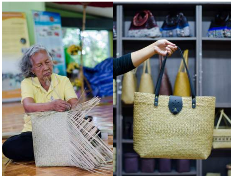
กลุ่มผลิตภัณฑ์จักสานกระจูดบ้านมาบเหลาชะโงน ผลิตภัณฑ์จากการสานกระจูด