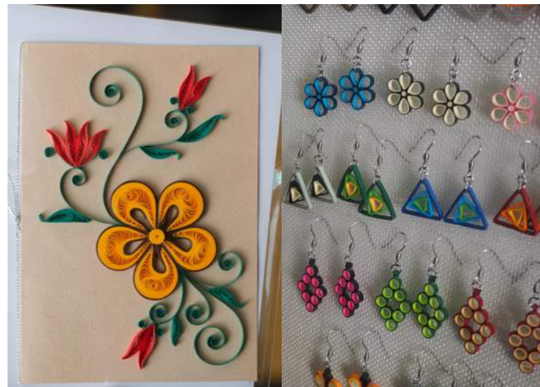
บ้านกระดาษสวย ผลิตภัณฑ์ทำมือจากกระดาษ