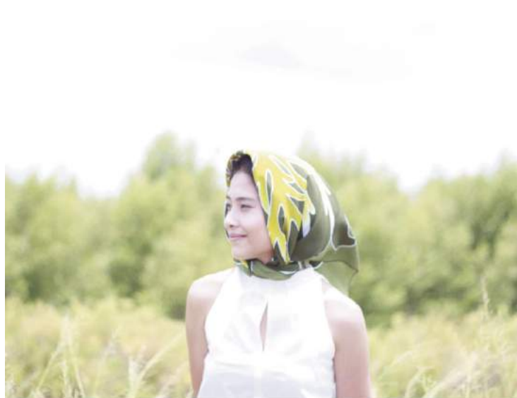
วิสาหกิจชุมชนกลุ่มบาติกแม่บ้านทหารเรือ ผลิตภัณฑ์จากผ้าบาติก