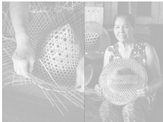
วิสาหกิจชุมชนกลุ่มแม่บ้านบางพระสามัคคี ยกทรงยุพินแปดริ้ว