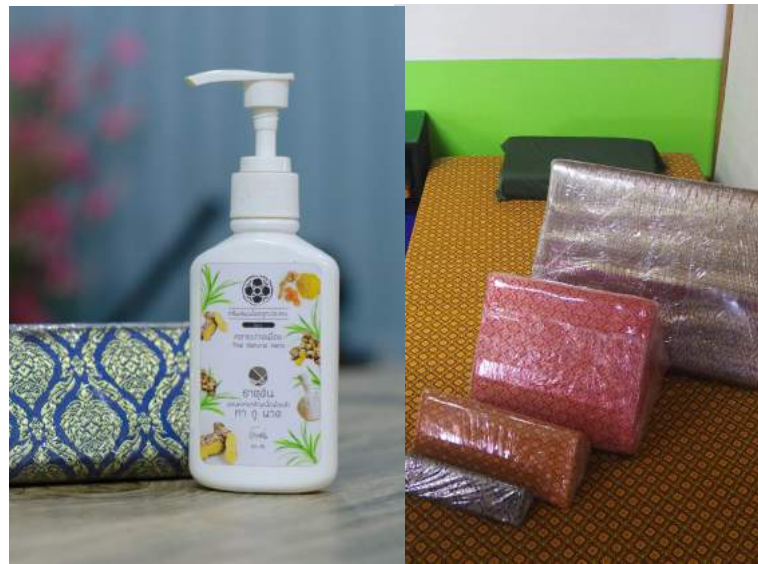
บ้านประคบทองไทยสปา ผลิตภัณฑ์หอมและโลชั่นนวดเพื่อสุขภาพ